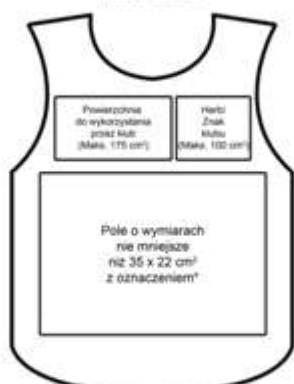
STANDARDOWE ZAGOSPODAROWANIE POWIERZCHNI -przód znacznika

*Najpóźniej niż w drugim okresie (PZ, TV, RP, TV, TV, PZ, TV) i wykształcił nie więcej niż 13 cm - front, 'Tabela Białe', pod wie. Najpóźniej powinien być umieszczony numer porządkowy 001.000.000. 001 z wykształcił nie więcej niż 7 cm - front, 'Tabela Białe'.