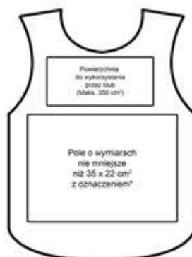
STANDARDOWE ZAGOSPODAROWANIE POWIERZCHNI -tył znacznika

*Najpóźniej niż w drugim okresie (PZ, TV, RP, TV, TV, PZ, TV) i wykształcił nie więcej niż 13 cm - front, 'Tabela Białe', pod wie. Najpóźniej powinien być umieszczony numer porządkowy 001.000.000. 001 z wykształcił nie więcej niż 7 cm - front, 'Tabela Białe'.